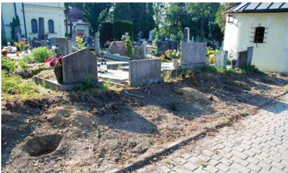
Trwają prace remontowe na cmentarzu na Bobrku, których efektem będzie m.in. odnowione ogrodzenie oraz nawierzchnie alejek.