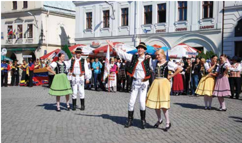
2 września w Cieszynie ponownie zobaczymy studenckie zespoły folklorystyczne z całego świata.