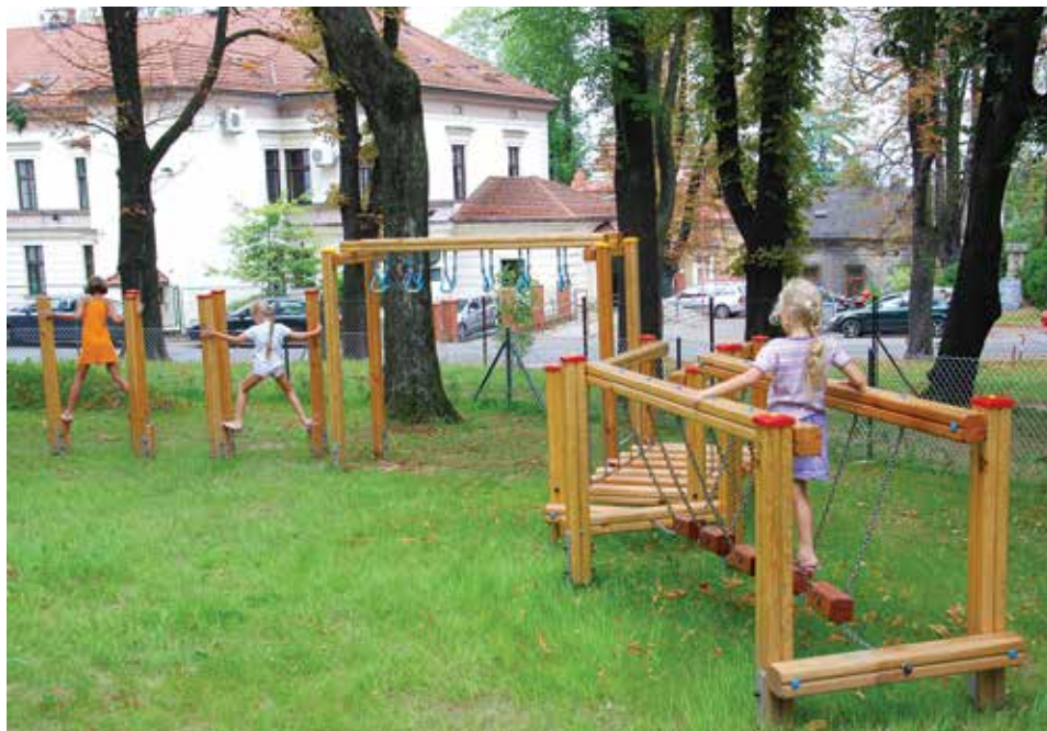
Od 9 sierpnia dzieci mogą korzystać z atrakcji czekających na nie w Parku Kasztanowym.