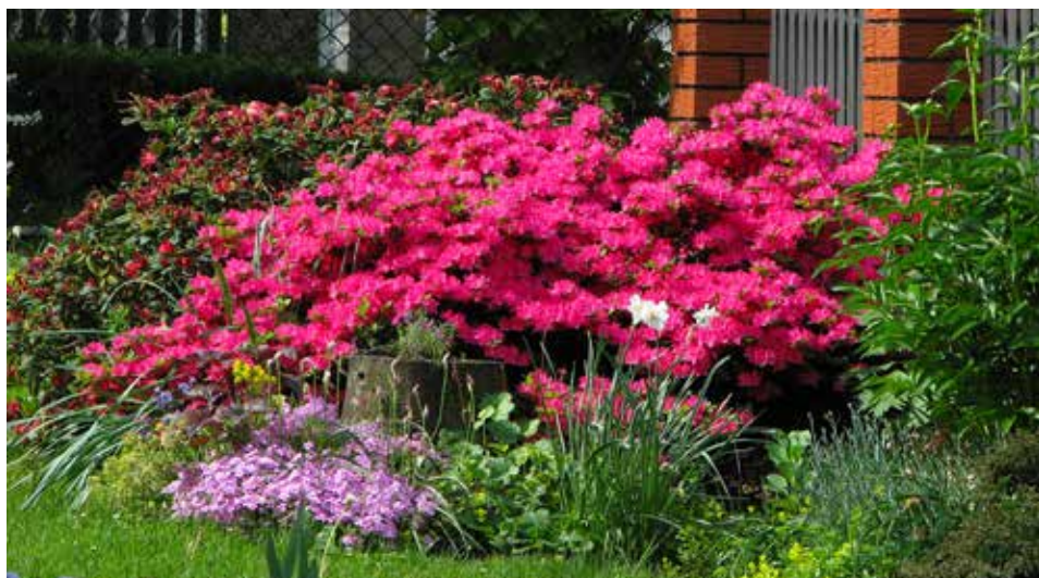
Właściciele pięknych ogrodów zachęcamy do zgłoszenia się do udziału w konkursie do 23 sierpnia.