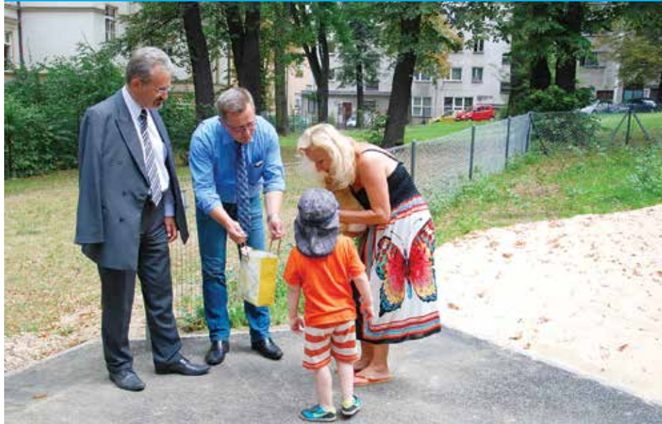
Otwarcia placu zabaw towarzyszył słodki poczęstunek dla maluchów.