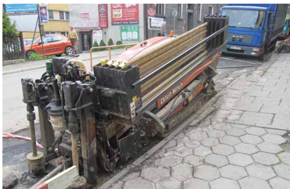
Maszyna wykonująca przewiert.

Roboty budowlane w śródmieściu Cieszyna, realizowane w ramach projektu „Uporządkowanie gospodarki ściekowej w aglomeracji cieszyńskiej” (współfinansowanego ze środków Unii Europejskiej), prowadzone są w trzech technologiach: otwarty wykop, przewiert sterowany, modernizacja kanałów metodą bezwykopową, tzw. „ciasno-pasowanego rękawa”. Metoda bezwykopowa została opisana w „Wiadomościach Ratuszowych”, które ukazały się 5 lipca 2013 roku.