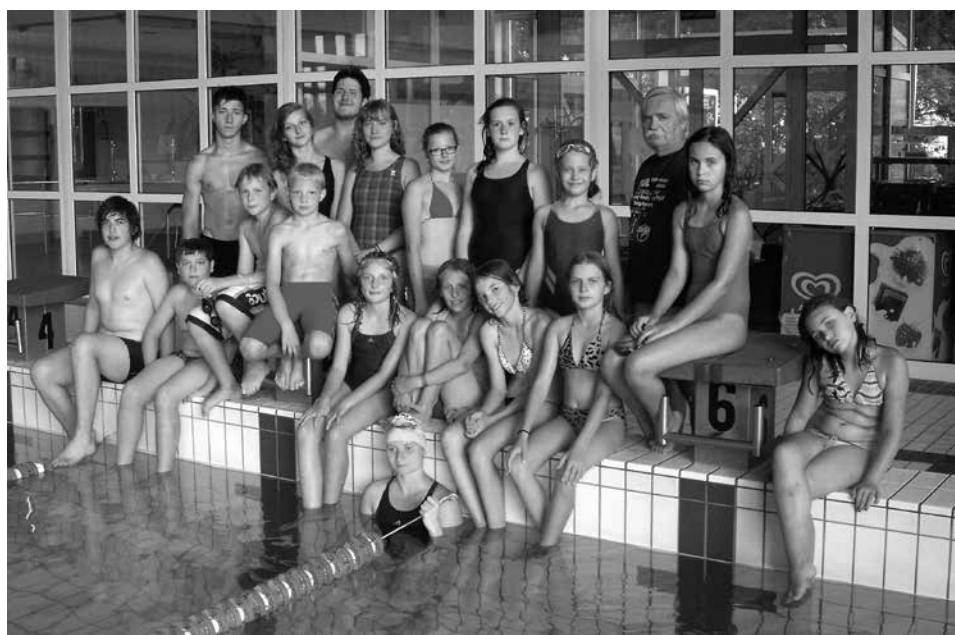
Obozowicze po treningu na krytym basenie.