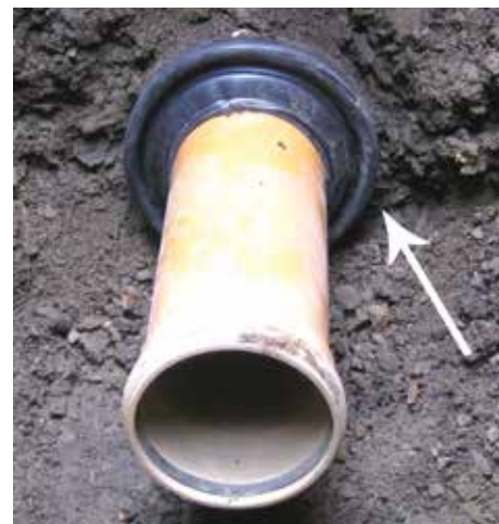
Manszeta założona na rurociąg.