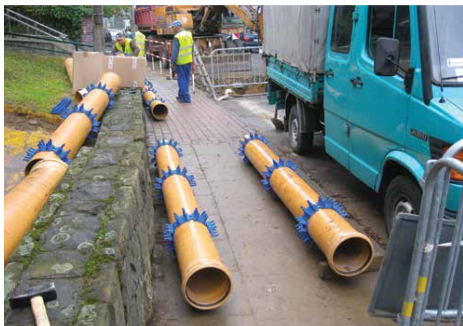
Płyzy (niebieskie) założone na rurociąg.

Metoda przewiertu sterowanego stosowana jest w miejscach, gdzie niemożliwe jest wykonywanie robót otwartym wykopem ze względu na gęste uzbrojenie terenu lub zbliżenie do obiektów będących w bezpośredniej strefie oddziaływania wykopów. Stosuje się ją przy budowie np. kanalizacji, wodociągów, gazociągów czy linii energetycznych.