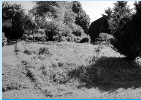
Nieruchomość przy ul. Mickiewicza przeznaczona do dzierżawy w celach rekreacyjnych.

Burmistrz Miasta Cieszyna ogłasza ustny przetarg nieograniczony na zagospodarowanie w formie dzierżawy z przeznaczeniem na cel rekreacyjny nieruchomości Gminy Cieszyn.